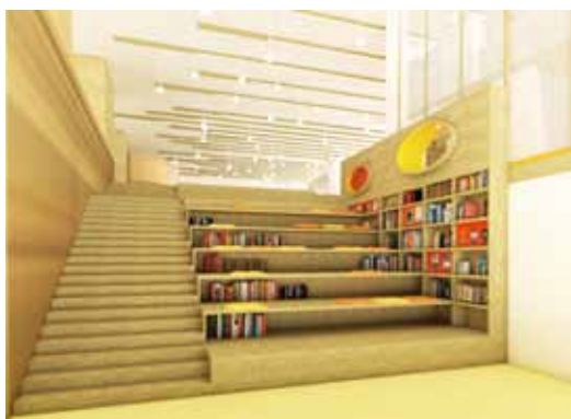
渋谷区子育てネウボラ室内

答弁 (区長) 「宿泊型産後ケア」は大変好評です。平成30年6月より開始し、1月までの8ヶ月で99人が申請し、うち、すでに50人が通産219日利用しました。今後、利用者がさらに増えると考えております。