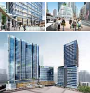
渋谷駅桜丘口地区再開発

『国際競争力への貢献』として、グローバル企業やクリエイティブ・コンテンツ産業等の起業支援施設のほか、外国人ビジネスマンの生活を支える国際医療施設、サービスアパートメント、子育て支援施設が整備されます。